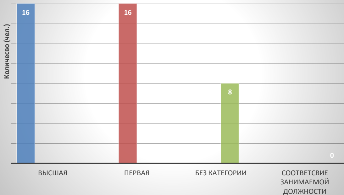
Диаграмма кадрового состава